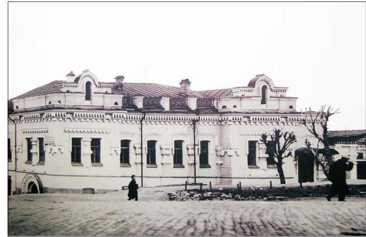
Дом Ипатьева в Екатеринбурге, где были убиты Царская семья и верные слуги

московской клинике. Таким образом, один из всех заключенных «дома особого назначения» точно знал о скорой казни. Знал и, имея возможность выбора, предпочел спасению верность присяге, данной когда-то царю. Вот как это описывает Мейер: «Видите ли, я дал царю честное слово оставаться при нём до тех пор, пока он жив. Для человека моего положения невозможно не сдержать такого слова. Я также не могу оставить